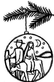
2. Advent: Auf den Weg machen