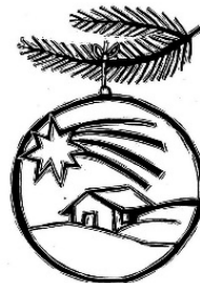
4. Advent: Erfüllung erwarten