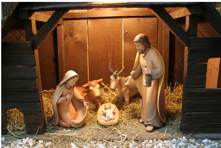
Foto: Krippe in St. Aegidius Kirche, St. Ilgen, 2016